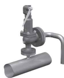
Правильная установка для воды